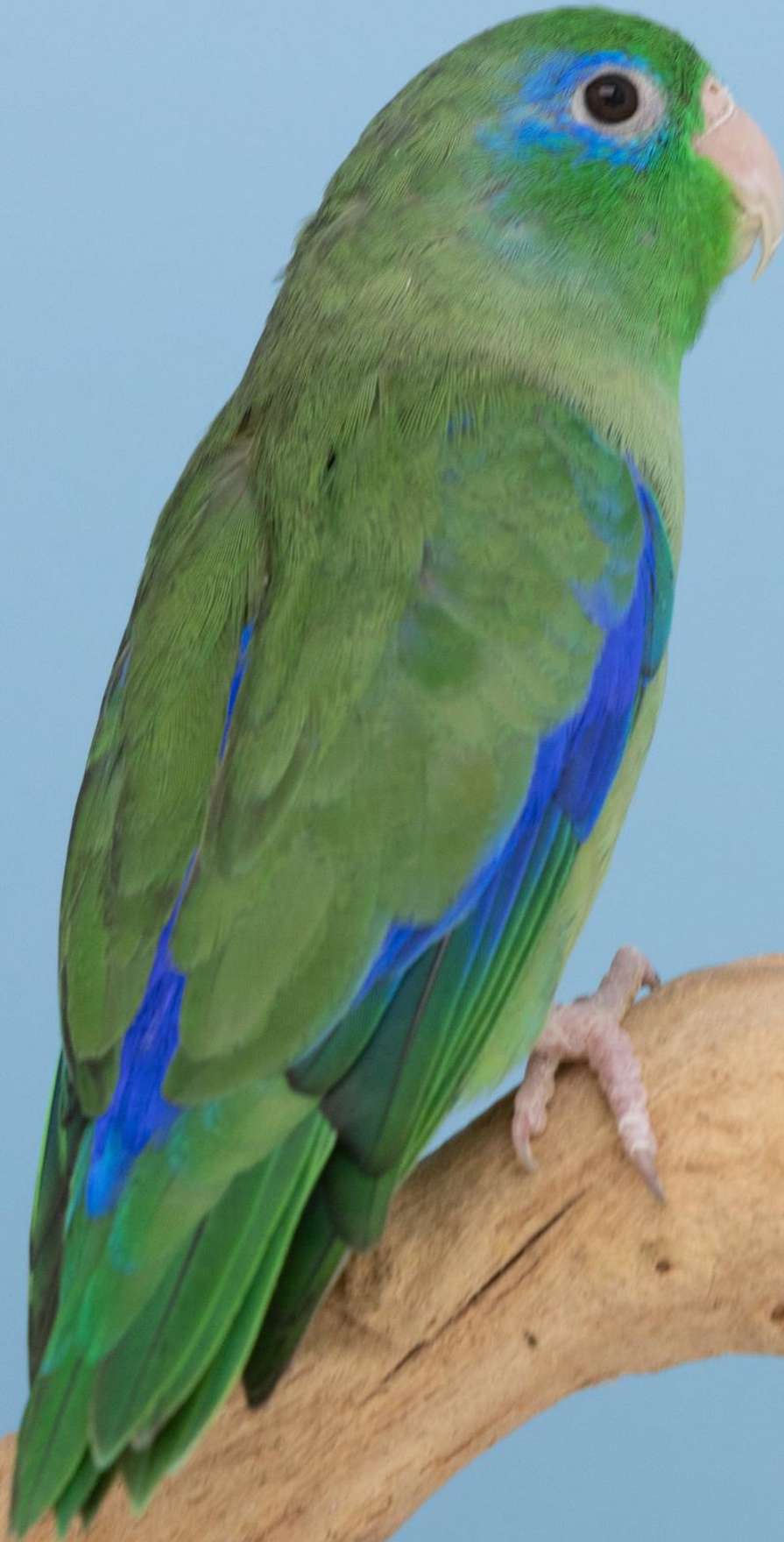
Oogring dwergpapegaai Forpus conspicillatus conspicillatus